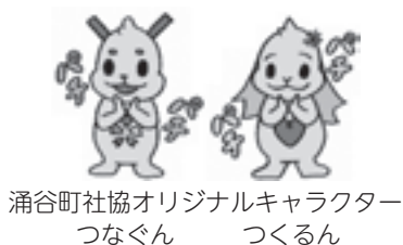
涌谷町社協オリジナルキャラクター つなぐん つくるん